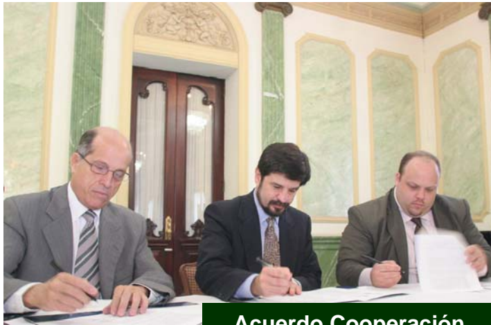
Acuerdo Cooperación (Enero 2006)