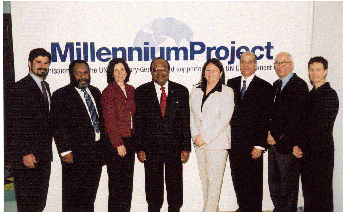
Lanzamiento Informe ODM 7 – Proyecto del Milenio ONU