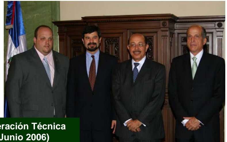
Acuerdo de Cooperación Técnica Internacional (Junio 2006)