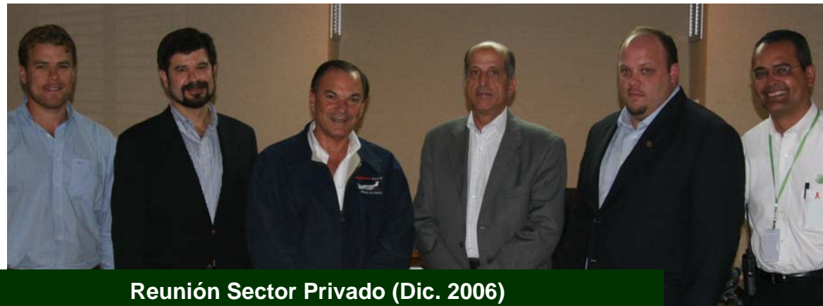
Reunión Sector Privado (Dic. 2006)