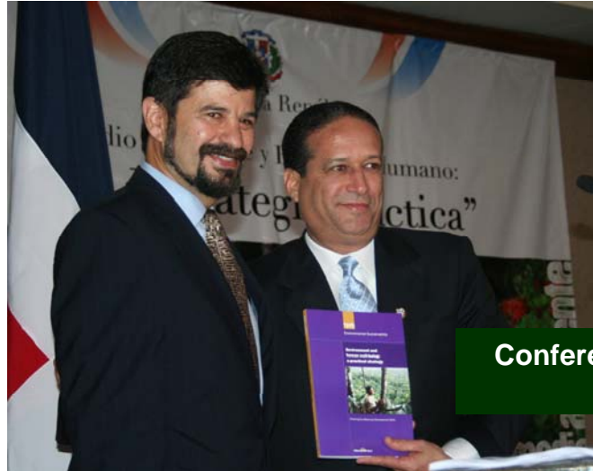
Conferencia Magistral ante Senado (Oct. 2006)